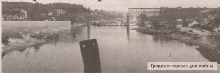
Гродно в первые дни войны